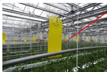
害虫捕殺粘着シート